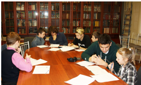
Математический цветник. Старшеклассники принимают решения задач у учеников академических классов

Математические цветники (декабрь, май) – дважды в год ЛНМО проводит соревнования по решению математических задач для учеников 4–5 классов. Это не только подведение итогов работы в кружках, это процесс взаимодействия старшеклассников, которые принимают устные ответы «академиков» и выставляют за эти ответы баллы. По результатам выступлений на «Цветниках» во многом принимается решение о выборе профиля для дальнейшего обучения.