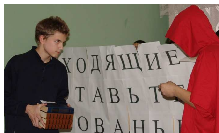
Постановка выпускников 2007 года по мотивам «Божественной комедии» Данте «Входящие, оставьте упования»

Академические субботы (конференции для подготовки к научным конференциям и конкурсам) – ежегодные презентации выполненных учениками ЛНМО исследований и проектов, призванные провести экспертизу научной и проектной работы в рамках Системы