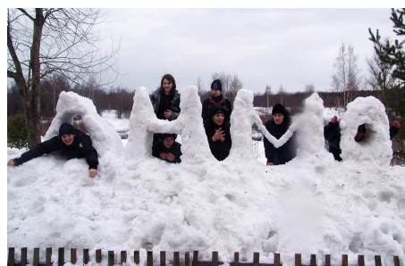
Поездка учеников 10 класса (выпуск 2011 года) в Приютино