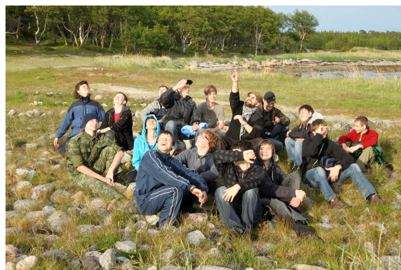
Путешествие на Соловки. Лабиринт

Таковы самые значимые события года. При этом у каждого класса ЛНМО своя насыщенная жизнь, которая включает в себя экскурсии, походы, театр.