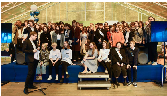
Награждение победителей и призеров научных конкурсов и конференций 2021–2022 учебный год, Последний звонок

Последний звонок и итоговый концерт ЛНМО – ежегодное событие, объединяющее учеников, родителей, выпускников всех площадок ЛНМО. Сочетает в себе праздничный концерт, прощание с выпускными классами, годовое отчетное мероприятие. Начиная с 2020 года проводится в Лисьем носу, что дает возможность использовать сцену шатра и возможности природной зоны.