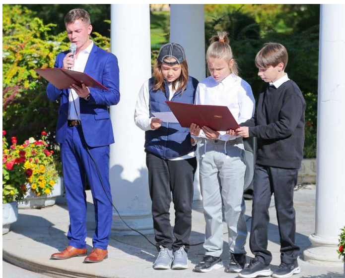
Чтение хартии пятиклассниками

3) Учеба в Лаборатории есть осознанный выбор каждого ученика. Никто не может быть принужден к этому выбору, но, сделав его, ученик обязуется добросовестно